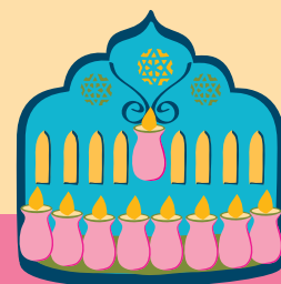
לאה מורחשתין-ירחוי | אמנות גופית