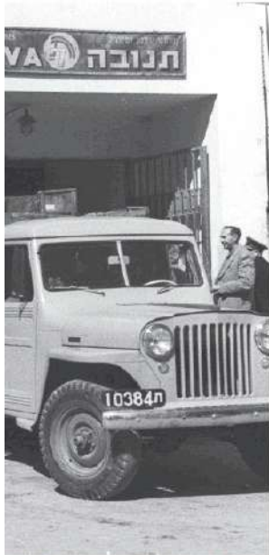
הקבוצים צריכים לבחון כל הזמן את האלטרנטיב