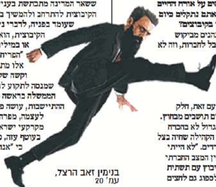
בנימין זאב הרצל, עמ' 20

או במילים אחרות: מנהל מקרקעי ישראלי. "המדינה של התנועה הקיבוצית בימים אלו מתבצעת כנגד התנגדות מכוונת וקשה של הממסד", אומר מאיר, "יש מי שמנסה לתקוע לנו בגלגלים. אף כי הממשלה וראש הממשלה כראש משרד בקול גדול על פיתוח התיישבות, עושה פקידות מנהל מקרקעי ישראלי רין לעצמה, מפרה את החלטות הממשלה ומעצת מקרקעי ישראלי, ובלמט את צמיחת הקיבוצים בעוטף עזה, כמו בשאר הארץ". הוא מוסיף, "כי 'אנחנו לא נתכבדו ולא נכנע, אנחנו היגונות המעשית עושה למען העם הארצי - עם או ללא עזרת מוסדות השלטון'".