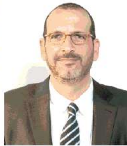
עו"ד בנג'ם הקיבוצים לא חוצים להשקיע

דולר המרות 10% ממניות חברת ההשקעה ב-2006. ב-2011 השליטה בנטפים נמכרה לקרן הוויה פרמירה לפי שווי של 850 מיליון דולר, כלומר חוזר של כ-180% לטנא תוך חמש שנים, במסגרת עסקה בה רכשה פרמירה 61% מהחברה. אגב, גם פרמירה רשמה אקזיט יפה כשמכרה אשתקד את ההחזקה בנטפים למקסימס ממקסיקו ב-1.16 מיליארד דולר, לפי שווי של כ-9 מיליארד דולר - תשואה של יותר מ-100%. קרן טנא הייתה גם המשקיעה הרהיבית בחברה הקיבוצית אבן קיסר,