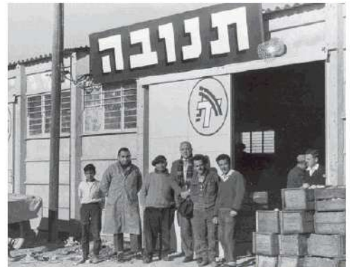
תנובה. "לחברה עדיין יש מונופול עצום"

"דיברט בשפות שונות" כל אופן, התברר על וחת השותף אינה סוף פסקו, מספר גולדמן. "כיום שאחרי מגיעה מחלבה עם ראש קיבוצי פעילות".