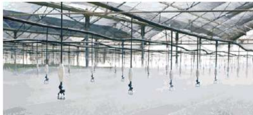
מערכות השקיה של חברת ריווליס שנמכרה לג'ון דיר ופימי

פער גדול מדי בין העובדים להנהלה. זהו השקע בדיבורים מנועים בקיבוץ מהקיבוץ מביע או פוגע בהבדלה? אם יש מישור מהקיבוץ שיכול לאייש את המשרה צריך לתת לו העדפה. במיטרוניקס כל פעם שמתפנה משרה אנחנו מפרסמים אותה גם בלוח המודעות של הקיבוץ ואם יש מועמד ראוי מתוך הקיבוץ אנחנו מכוונן ניקח אותו."