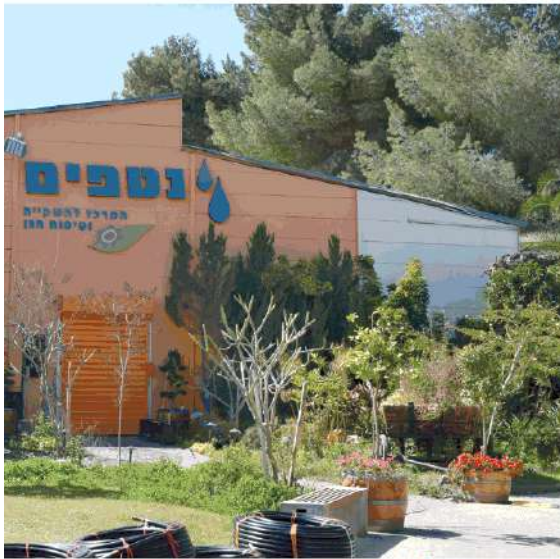
מפעל נטפים בבאר שבע שנוכח למכסיקם

אם בעבר העדיפו החברות הקיבוציות לגייס בבורסה, כיום ההעדפה היא לחפש השקעה של קרנות פרטיות • יו"ר איגוד התעשייה הקיבוצית: החוקים הקשוחים של רשות ניירות ערך גרעו בנו • מה יהיה מודל הצפת הערך הבא? / קובי ישעיהו