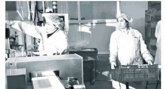
מעל שום של חברת דורות, קיבוץ דורות. יצואות לפנסיה מאוחרת.

מאת רוז שטיין הקיבוצים היו מאז ומתמיד רשת סוציאלית תומכת עבור החברים בהם, מלירה ועד מוות. לכן, למרות שלאורך השנים בחלק מהקיבוצים הרשת הזו הפכה למלאת חורים, אין פלא שעריין מדובר, בין היתר, ברשת הביטחון היחידה בישראל שנתנת הכנסה מספרית לקצבת ויקנה מינימלית לגמלאים, ושאינה פנסיה תקציבית או ותיקה שהיא שירד לעיני נדיב לא יציב מבחינה כלכלית. עם זאת, זה לא אמר שמדובר בפועל בקצבות בזהות מאלה שנוגזות בשוק "הרגיל", שם נצברת קצבה בהתאם לשכר המבוטח. במה מדובר? בתקנות האגרות השיתופיות (ערכת הדידת בקיבוץ