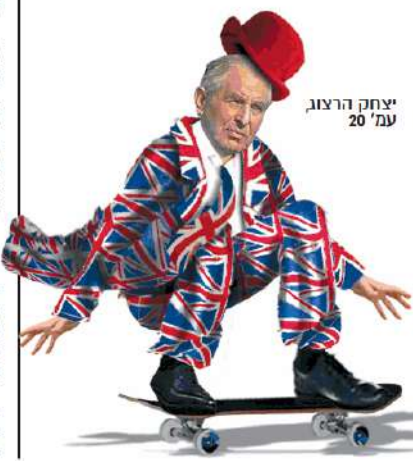
יצחק הרצוג, עמ' 20

השמים הם הגבול. אבל כל דבר נבון כמבוק התוצאה, ומיקומה של תנובה מאו כניסת הסינים וער היום הוא מאכזב". בתנובה לרברים על אייפקס, מסרו גורמים שהיו מקורבים לחברה בעבר, כי "אייפקס השקיעה בכל שנה בתנובה 300 מיליון שקל במשך יותר משבע שנים. בתקופה זו גדל מספר העובדים בחברה ככ-10%. החברה הובילה בכל תחום בתקופת אייפקס.