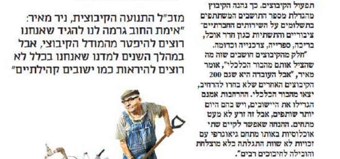
71 אשכול, עמ' 20