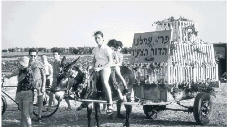
הקיבוצים התאוששו מהמשברים וחזרו לפרח

כמה שנים אחרי התברר שהסדר שנכנע עבור 57 קיבוצים, בעיקר בפריפריה - לא פתר את הבעיות, הם התרוקנו מחזרים ונכסים, ונצמד סיכון עבורים של נקודת התמיכה. עבורים נחתם ב-1996 "הסדר משלים" שבכיסו נקבע כי קרקעות באזורי ביקוש שום נבעלות "קיבוצי גדול" חזקים, שאינם זקוקים למחיקה ופריסה, יועברו למדינה - למינהל מקרקעי ישראל (היום רשות המקרקעין). יש שראו בזה "עונש" לקיבוצים החזקים שהצליחו לדרווח למרות הכל, אבל המדינה אמרה שבכך ימנעו את יתרת החובות הבלתי מכוסים. הקיבוצים נדרשו גם למכור 25% מהמניות שהיו להם או בתנאים.