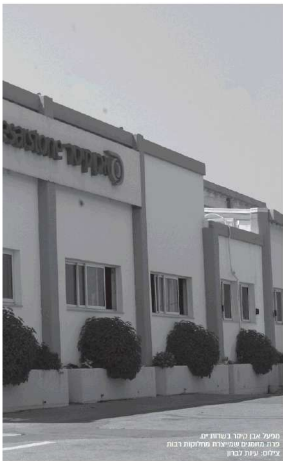
מפעל אבן קיסר בנחלת זית. פרת מוזתים שמייצרת מחלוקות רבות

צניחת מניית אבן קיסר ביותר מ-50% בתוך שנה, עזיבת המנכ"ל, תחרות גוברת והולכת מצד הסינים ושרשרת של תביעות משפטיות מטרידות את חברי הקיבוץ ומפלגות ביניהם, ולא בפעם הראשונה • צרות אמיתיות או צרות של עשירים? / הדס מגן