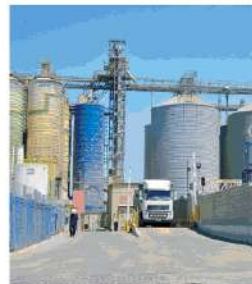
מפעל סולבר באשדוד נמכר ל-CHS

אולי היו צריכים להתיר את הקיבוצים? "נכון. אני הצעתי את זה בזמנו ליר"ד ורשות האחראי אבל התשובה שלהם הייתה שכלכלי המשק השתנו וזאת צריכים להתיישר לפי הכללים החדשים". זה גם לסלידה של מפעלים קיבוציים רבים לכל מה שקשור בשוק הון, בגלל חוסר האמינות בדרך שבה הדברים נעשו."