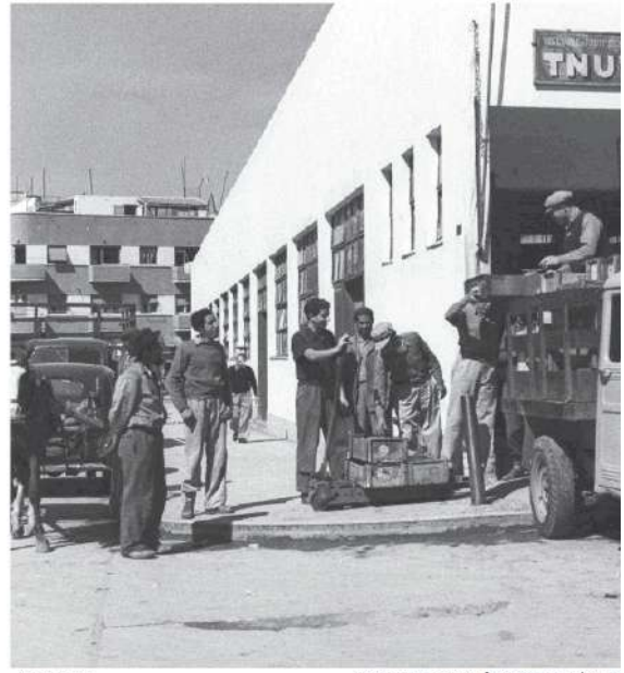
ת שלהם בהתייחס למה שקורה בתנובה

בעבר דיווח הקיבוץ כי השקיע בשנים מסוימות אפילו 95% מההכנסות של עסקיו בחזרה בפעילות, וחילק רק 5% בין החברים, כדי שניתן יהיה להמשיך לבנות את האימפריה. זו אינה גישה נגדית. היא מתאפשרת רק משום שה-5% לברם מספיקים לקיים את הקיבוץ, ההשקעה הגדולה נועדה לרוא כי המוצב יישאר כך. בשנה ממוצעת 30% מההכנסות משמשת להשקעה. חברת החזוהבה הוקמה ב-1990, אך עלתה מדרגה במקביל לאקזיט המשמעותי הראשון בנטפים. פעילות החזוהבה, כמו המפעלים הראשונים של נטפים, מתקיימת כאמור בסמוך לקיבוץ כך שאינה