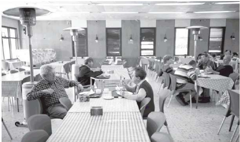
חדר אוכל. המס היה אסתי משום שחשוב לפי הכנסות הקיבוץ חלקי מספר החברים, כולל גמלאים ובלתי מועסקים.

ל מעלה מחצי מיליארד שקל - אלה ההכנסות שצפויה המדינה לקבל השנה לראשונה מהקיבוצים במסגרת הרפורמה במס הכנסה ותשלומי הביטוח הלאומי שהונהגה ב-2017. לפי הערכות, מחצית מהסכום יתקבל כמס הכנסה המחצית השנייה כרמי ביטוח לאומי. העובדה שחברי קיבוצים לא שילמו מעולם מס הכנסה היא תוצאה הגיונית לאור התפיסה השיתופית שבסיסה המרלית: כל חבר תורם כפי יכולתו ומקבל כפי צרכיו. בשורות הראשונות למדינת העתיד הכריז הקיבוץ ללא יוצא מהכלל את שרם לקיבוץ וקיבלו לשימוש האישי "קצב", ומשום כך לא היה מקום לטעות את הכנסתם. לפי ההסדר שפעל ב-69 שנותיה הראשונות של המדינה, חושב המס האישי שנקבע על בסיס גודל המשכורת וצרכי החבר. היפתן ומנכ"ל תנובה, אם תרצו קיבלו אותו מוקיבוץ דבר. על פי ההסדר ההיסטורי, הקיבוץ היה הנישום כמעט הבלתי הולט שיעור מס אחיד. לצורך קביעת שיעור המס נעשה חישוב של ההכנסה הממוצעת לחבר, כלומר ההכנסה החייבת הכוללת של הקיבוץ (כלל הרווחים מהפעילויות העסקיות השונות של הקיבוץ וההכנסות של חברים שעברו מחוץ לקיבוץ) חלקי כלל החברים בקיבוץ, כולל גמלאים ובלתי מועסקים. התוצאה הייתה ששיעור המס הסופי ששולם על כל חבר וחבר היה במקרה הטוב אחידים בודדים וברוך כלל