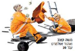
משה קצב ואהוד אולמרט עמ' 20

אפס. ההסדר היסטורי היה ממויך להיות בתוקף בקיבוצים השיתופיים, כ-45 במספר, ומושבים שיתופיים. שאר הקיבוצים, כ-230 במספר שייכים כיום לקטגורייה החדשה של קיבוץ מתחדש. בקבוצה הזו יש מנעד רחב יחסית של שיתופיות אבל ההבדל העקרוני לעומת הקיבוצים השיתופיים הוא שישנה התחשבות, ולו מינימלית, בתרומה הכלכלית האינדיבידואלית של כל חבר וחבר. רשות המסים טענה