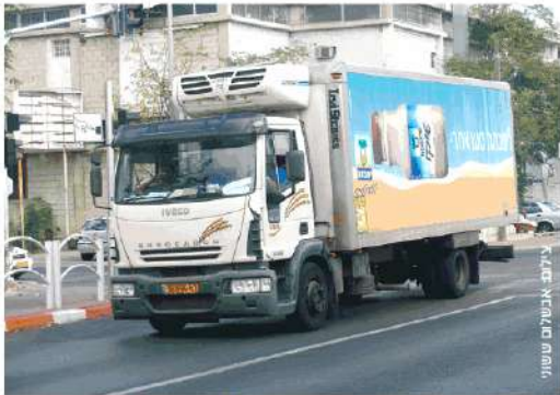
משאית של יטבתה. חבר קיבוץ שנוסע צפונה, עושה שיווק למצרי המחלבה

ביטבתה מרוצים מההחלטה למכור 50% מהמחלבה לשטראוס ולא לתנובה, לפני 20 שנה • "העובדים מרגישים בעלים, כשיש תקלה במחלבה זה מעסיק את כל הקיבוץ" / שני מוזס