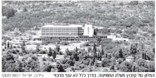
המלון של קיבוץ מעלה החמישה. בדרך כלל לא עניין מרכזי

שאפת משרד התיירות היא לחזק את אפיק התיירות הנכנסת לאירוח בקיבוץ. כיוון מחדר: "לנבנה חבילות אירוח שמכללות טיחה ולינה כפרית בקיבוץ. זה מיועד בעיקר לביקור שני ושלישי של תייר בישראל אבל יש פה הצעת ערך לא יקרה אגתנו מזהים בה פוטנציאל".