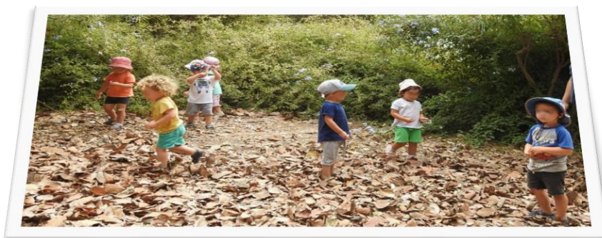
ילדי חצור מטיילים

העצים מקבלים בשמחה את הילדים שבאים לשתול צמחים בט"ו בשבט ויוצאים איתם בריקוד שמח.