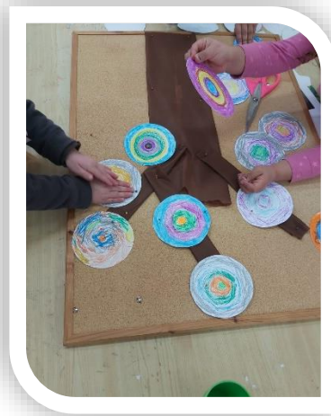
יצירת עצי דמיון המבוססים על העיגולים של קנדינסקי