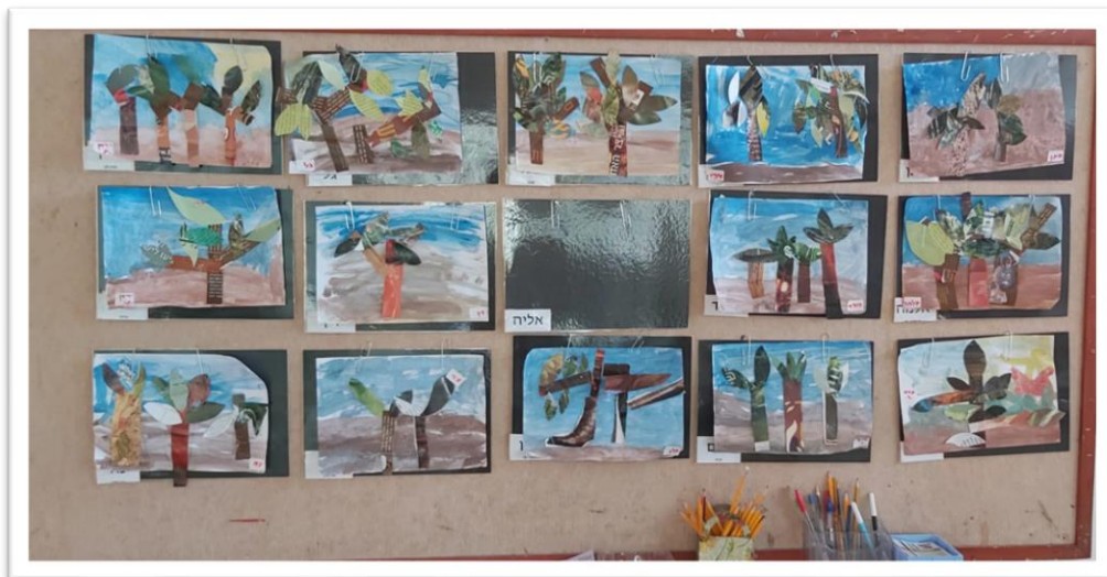
עצים על רקע גואש, עשויים מתמונות שנגזרו ממגזינים