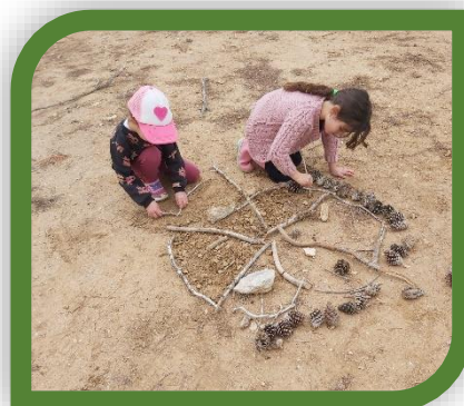
יצירה בשטח מחומרי טבע