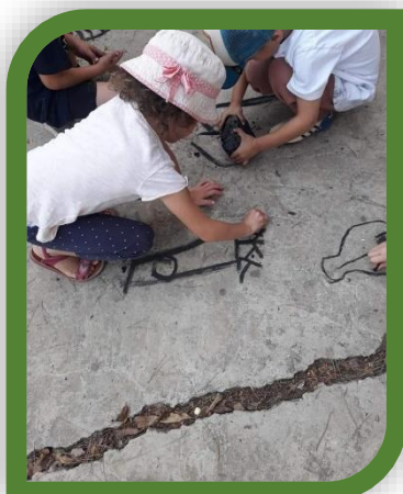
צור בפחם בעקבות עץ הזית של אנה טיכו