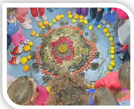
יצירת מנדלה משותפת מחומרים שאספנו